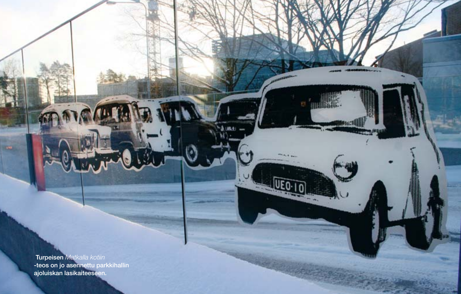
Turpeisen Matkalla kotiin -teos on jo asennettu parkkihallin ajoluiskan lasikaiteeseen.

Vantaan taidemuseo sai kaupungilta tehtäväkseen valita taiteilijat Tikkurilan uudistuvan keskustan julkisen taiteen tekijöiksi.